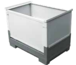
FP-1 Monolit oldalfalas modell